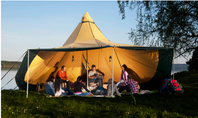
Zwei Sektionen aufgeklappt