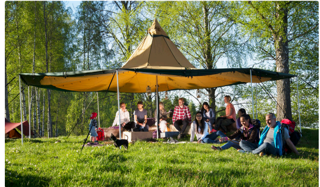
Alle Sektionen aufgeklappt

Im Preis inbegriffen ist das zum Aufstellen des Zeltes mit zwei aufgeklappten Sektionen benötigte Material. Zum Aufklappen weiterer Sektionen müssen zusätzliche Teleskopstangen, Flexriemen und Stahlnägel gemäß Tabelle gekauft werden.