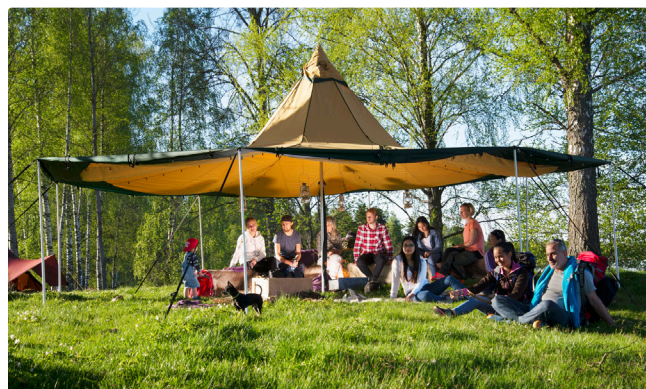
Huit sections relevées

Le prix d'achat s'entend avec tout le matériel nécessaire pour dresser la tente avec deux sections relevées. Pour les autres sections, compléter avec des tiges télescopiques, des sangles flex et des piquets acier selon le tableau ci-dessous.