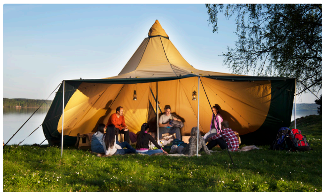
Zwei Sektionen aufgeklappt