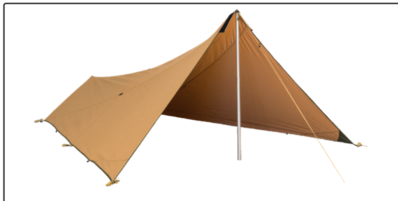
Bâche 7/9 montée comme protection contre le vent