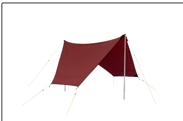
Bâche 5/7 en version légère, montée de manière indépendante

Il est conseillé de se mettre à deux pour placer la bâche de cette façon. La première personne place l'œillet de la fixation velcro dans une tige télescopique et fixe la cordelette au sol avec un piquet. Tandis que la première personne maintient la tige télescopique à la verticale, la deuxième personne fixe une tige télescopique plus la cordelette sur le côté opposé. Pour la taille 7/9, deux tiges sont nécessaires de ce côté. On peut également placer ici une troisième tige, de la même manière que lorsque la bâche est montée sur le tipi nordique. Sur les côtés longs, les cordelettes se fixent avec des piquets. Toutes les cordelettes sont ajustées ensuite avec leurs tendeurs respectifs. La bâche 5/7 est fixée par deux cordelettes sur chaque côté long, tandis que pour la bâche 7/9, une seule peut suffire de chaque côté, grâce à la tige télescopique supplémentaire. Il y a aussi deux cordelettes sur chaque côté long que l'on peut fixer pour la bâche 7/9, si cela est nécessaire pour une meilleure stabilité.