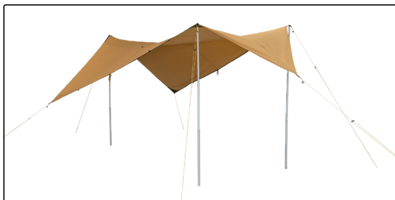
Bâche 7/9 montée de manière indépendante