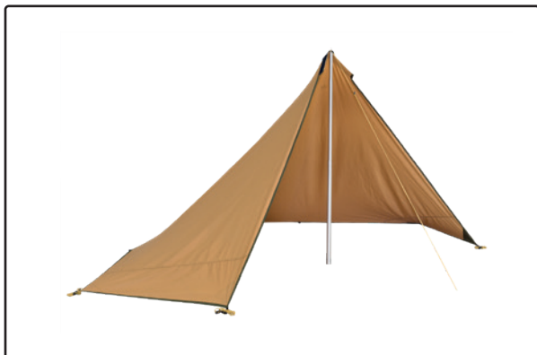
Bâche 5/7 montée comme protection contre le vent

Poser d'abord un piquet dans l'œillet de sangle, sur le côté en face de celui avec une fixation velcro. Fixer une tige télescopique dans l'œillet de la fixation velcro et ajuster à la bonne hauteur. Fixer la cordelette avec un piquet et tendre la cordelette. Poser des piquets le long des côtés longs. La bâche 5/7 a des œillets de sangle pour deux piquets de chaque côté, tandis que la bâche 7/9 a des œillets de sangle pour trois piquets de chaque côté.