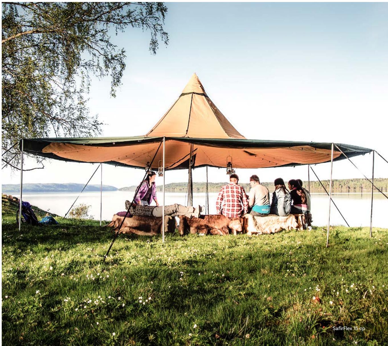
SafirFlex 15 cp