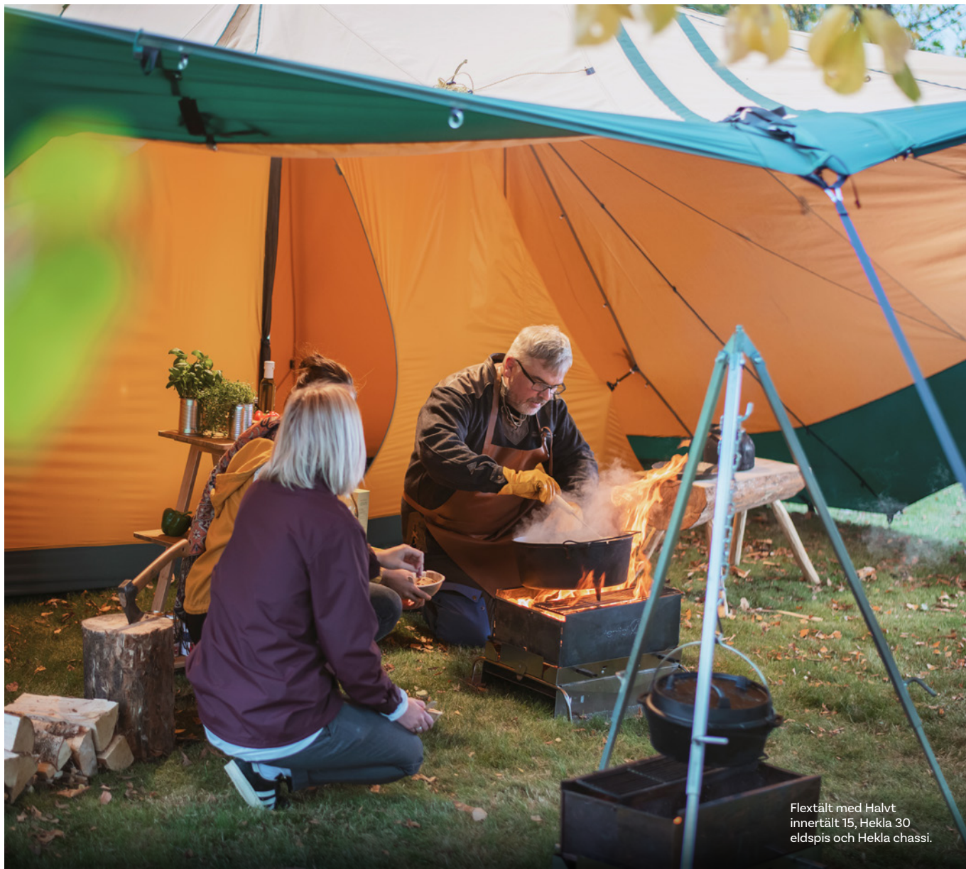
Flextält med Halvt innertält 15, Hekla 30 eldspis och Hekla chassi.