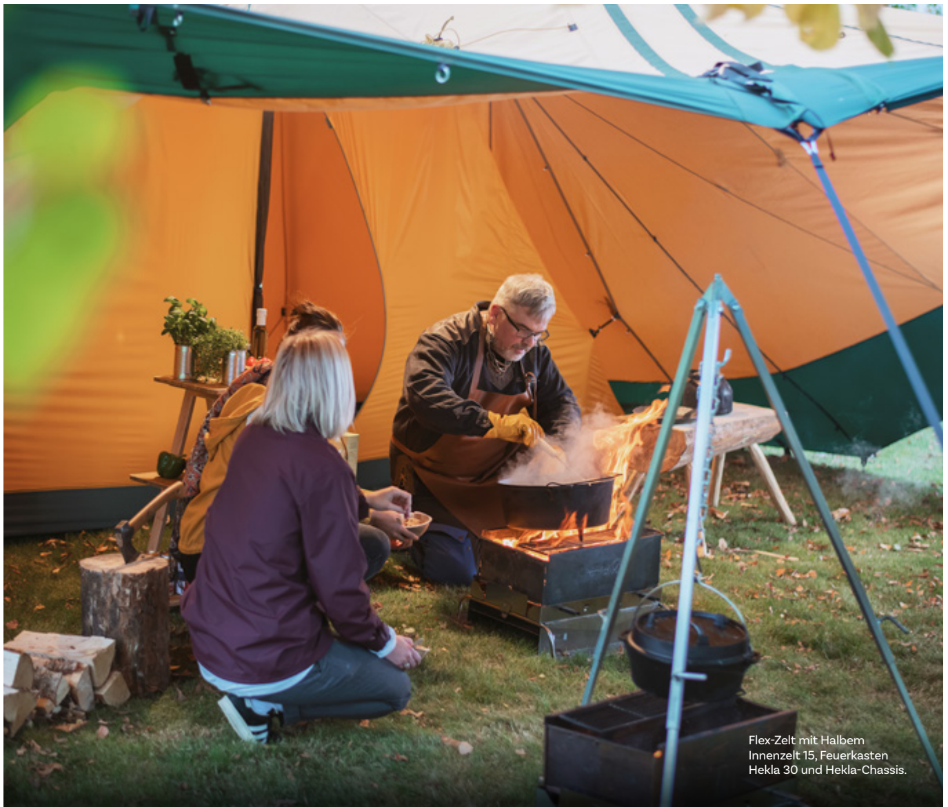
Flex-Zelt mit Halbem Innenzelt 15, Feuerkasten Hekla 30 und Hekla-Chassis.