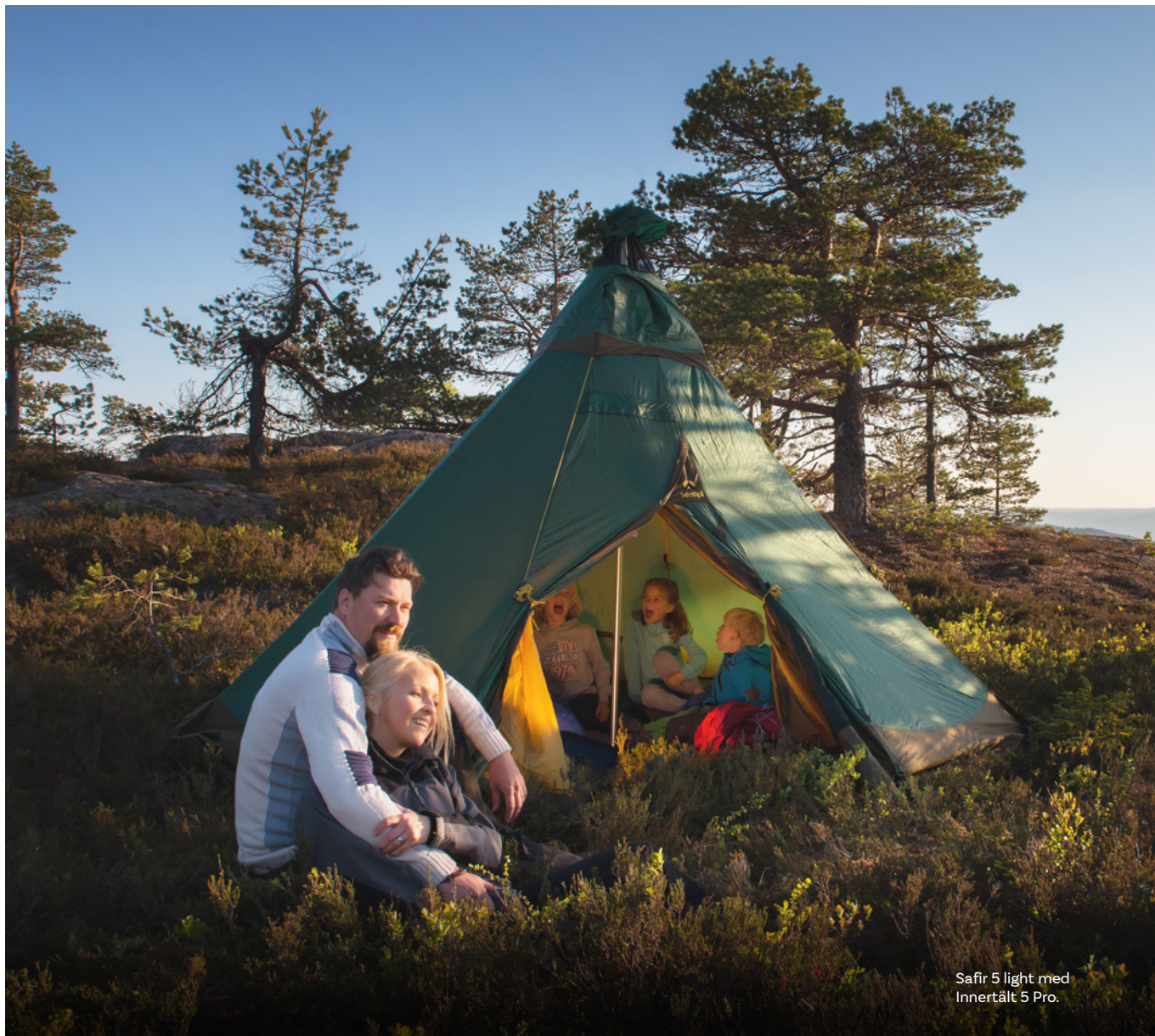
Safir 5 light med Innertält 5 Pro.