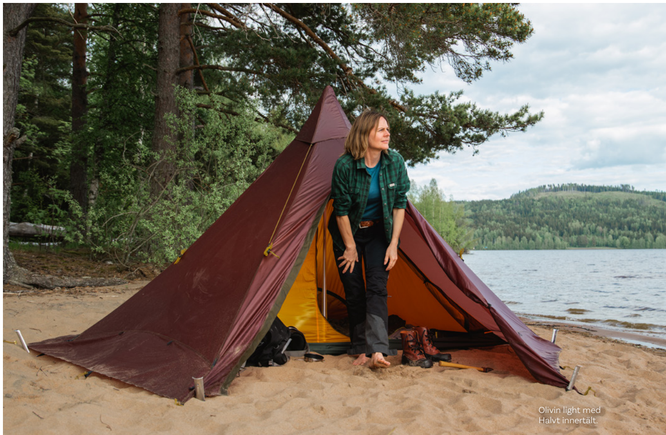
Olivin light med Halvt innertält.