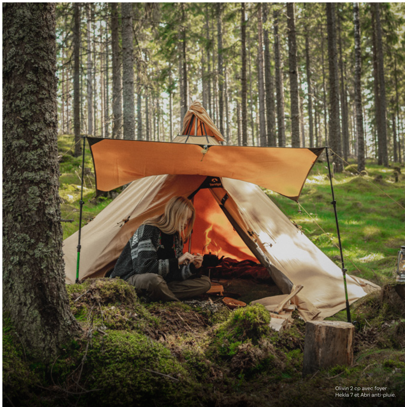
Olivin 2 cp avec foyer Hekla 7 et Abri anti-pluie.