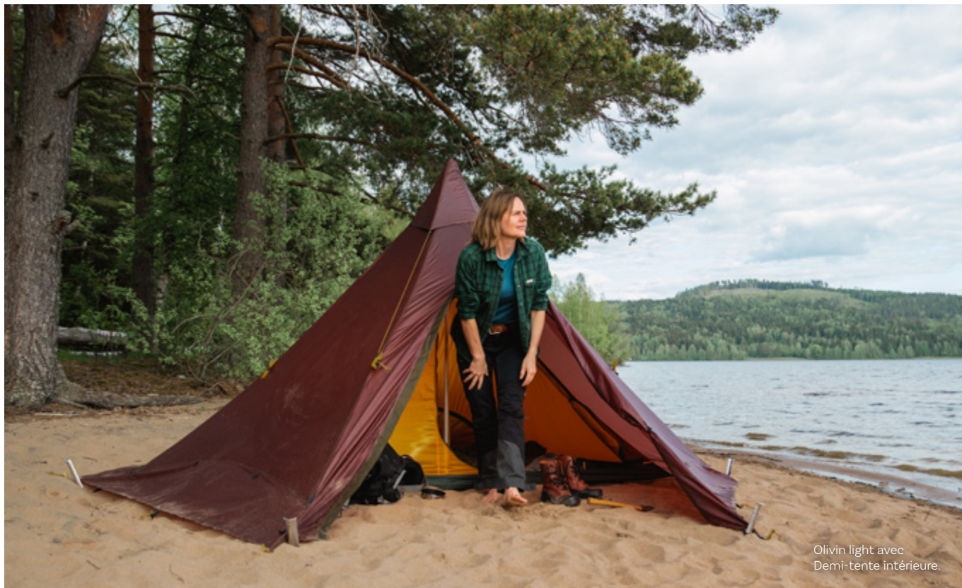
Olivin light avec Demi-tente intérieure.