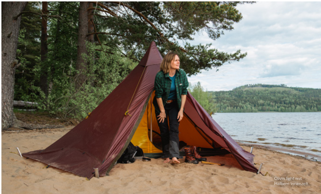
Olivin light mit Halbem Innenzelt.