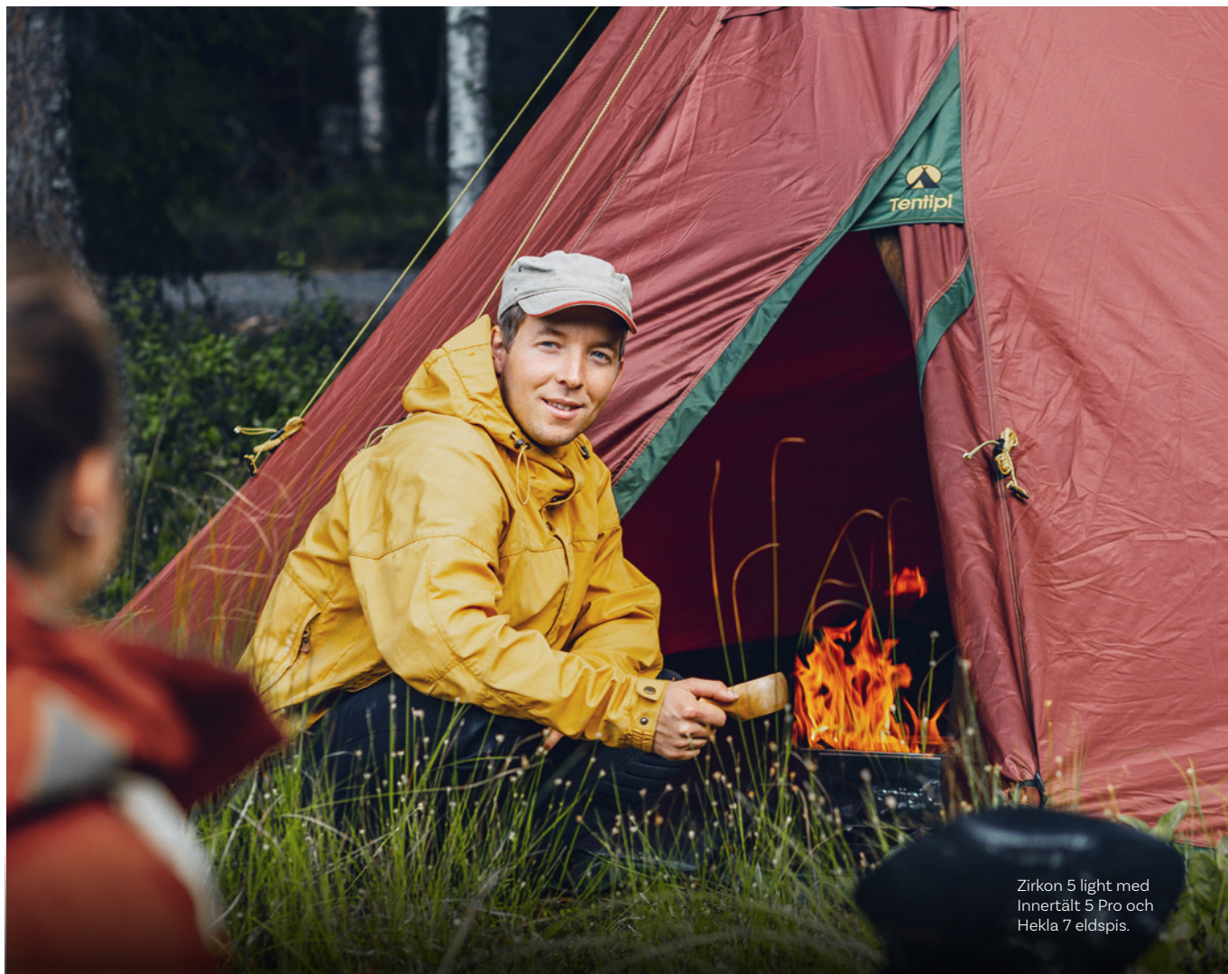
Zirkon 5 light med Innertält 5 Pro och Hekla 7 eldspis.