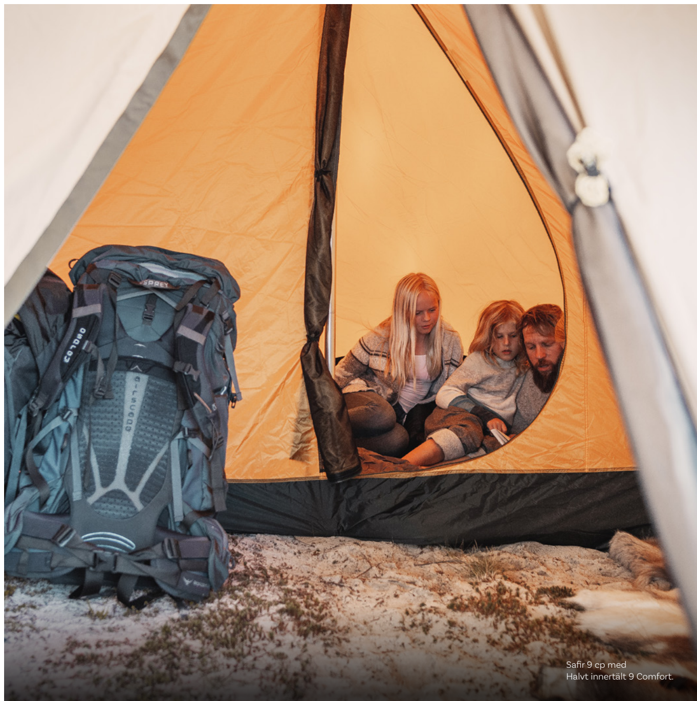
Safir 9 ep med Halvt innertält 9 Comfort.