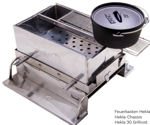
Feuerkasten Hekla 30 Hekla-Chassis Hekla 30 Grillrost

Wenn Sie auf Schnee feuern wollen, ist der Feuerkasten unverzichtbar. Die Metallschienen auf der Unterseite des Kastens werden auf Äste platziert, die zuvor auf den Schnee gelegt werden. So verhindert man, dass der Feuerkasten im Schnee einsinkt. Das Hekla-Chassis ist eine andere Alternative, die das wärmebedingte Einsinken in den Schnee verhindert.