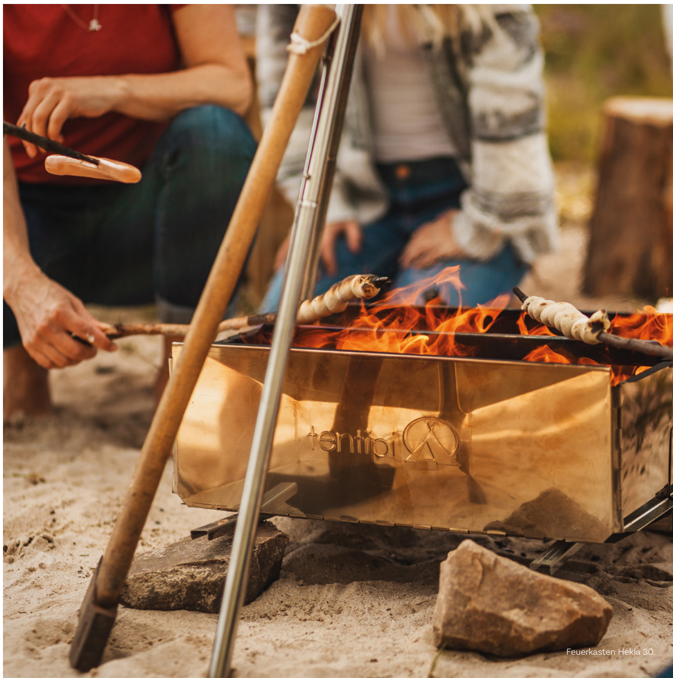
Feuerkasten Hekla 30.