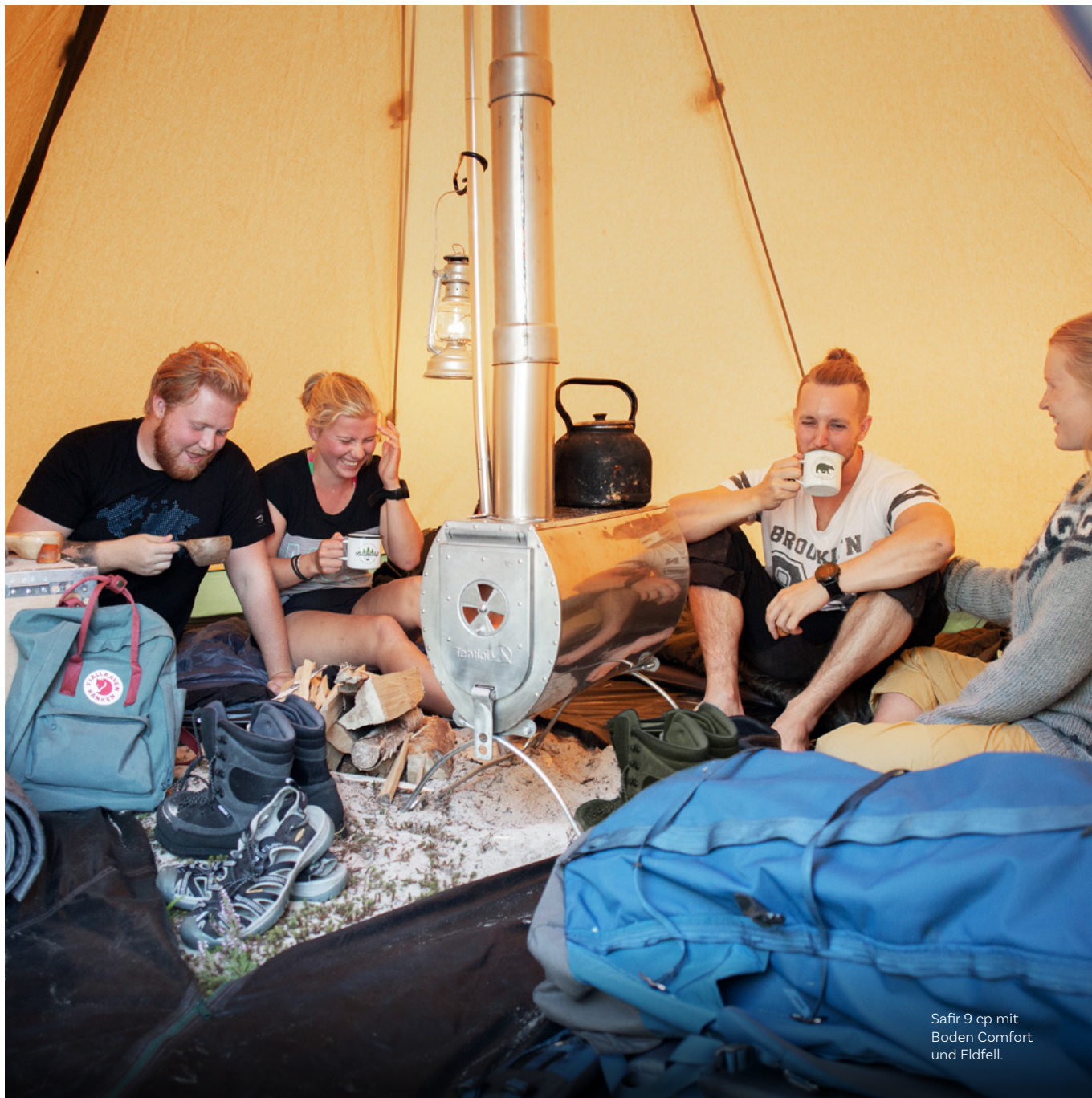
Safir 9 cp mit Boden Comfort und Eldfell.