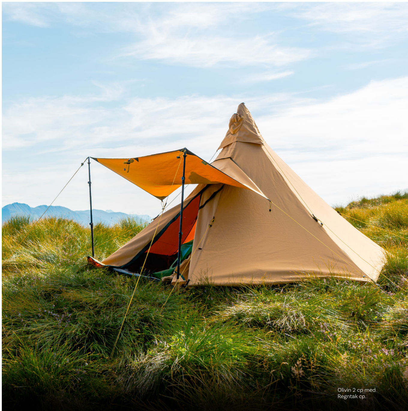
Olivin 2 cp med Regntak cp.